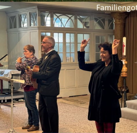
Familiengottesdienst und Gemeindepicknick