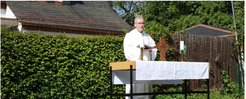
Freiluftgottesdienst zu Christi Himmelfahrt

Monatsspruch August: Ich danke dir dafür, dass ich wunderbar gemacht bin; wunderbar sind deine Werke; das erkennt meine Seele.